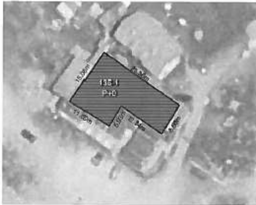
Ortofoto.1 – Paracitja e gjendjes grafike e ngastrës kadastrale 135-1 si dhe Objekti brenda ngastrës

Sipërfaqja totale sipas gjendjes faktike në terren pjesë e shitjes në këtë Njësi është vetëm sipërfaqja 5=273m 2 që sa edhe figuronë të jetë prona sipas Certifikatës Pronësore.