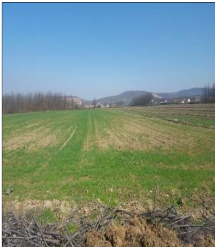
Fotoja Toka në Elezaj

AGJENCIA KOSOVARE E PRIVATIZIMIT KOSOVSKA AGENCIJA ZA PRIVATIZACIJU PRIVATISATION AGENCY OF KOSOVO