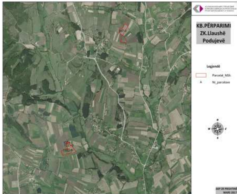
KB Përparimi Tokë Bujqësore Llaushë – orientimi nga gjeoportali

Foto/fotot Ose informata të tjera Për asetet në shitje