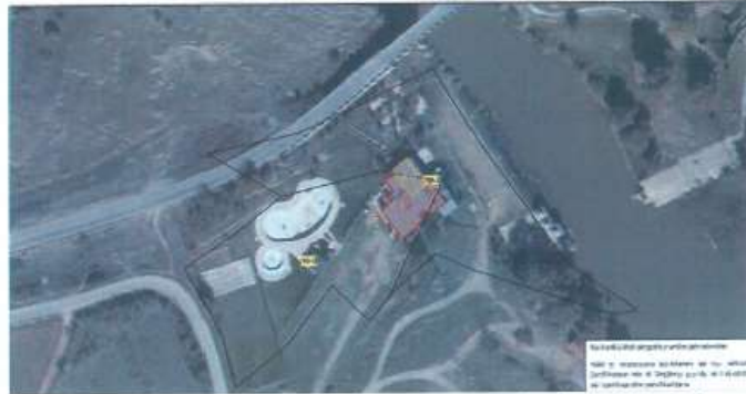
Fig.1 Ortofoto, Objekti-Shtrirja e tij në parcelat kadastrale 89-0 dhe 90-0

Me rastin e daljes në terren me datë 06.09.2023 është bërë identifikimi dhe matja e objektit i cili gjendet në Fshatin Fshaj, 7ona kadastrale Ujz, Komuna e Gjakovë.