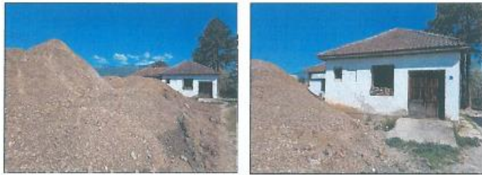
Stacioni i Veterinës në z.k Gjurakoc, Komuna e Istogut

Të vetmin ndryshim nga vizita e fundit në terren e konstatuam se në afërsi të objektit zhvillohen punime dhe aty janë grumbulluar masa të mëdha të dheut.