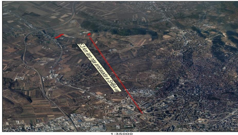
Ortophoto orientuese KB Liria toke bujqesore Bërnice e Poshtme VII

Nijedna informacija o predmetu prodaje, predstavljena u ovom izveštaju o činjenicama, nije garantovana. Potencijalni investitori se podstiču da kontaktiraju Kosovsku agenciju za privatizaciju (KAP) da zatraže tendersku dokumentaciju. Oni koji žele da podnesu ponudu moraju se osloniti na sopstvenu istragu. Potencijalnim investitorima se savetuje da obave sopstvenu proveru pre podnošenja bilo koje ponude ili tenderskog predloga. Ova dokumentacija je na raspolaganju prema opštim uslovima odredbe o pružanju informacija opštoj javnosti o kandidatima za privatizaciju, koje se mogu skinuti sa zvanične veb strane KAP-a http://www.pak-ks.org