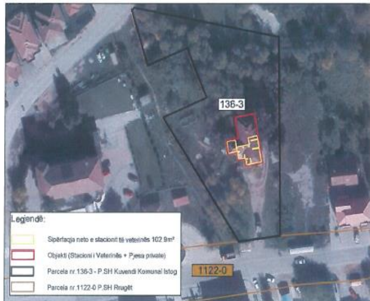
Ortofoto, Stacioni i Veterinës në z.k Gjurakoc, Komuna e Istogut

Me datë 10.07.2023 zyrtarët e AKP-së vizituan Stacionin e Veterinës në z.k Gjurakoc, Komuna e Istogut.