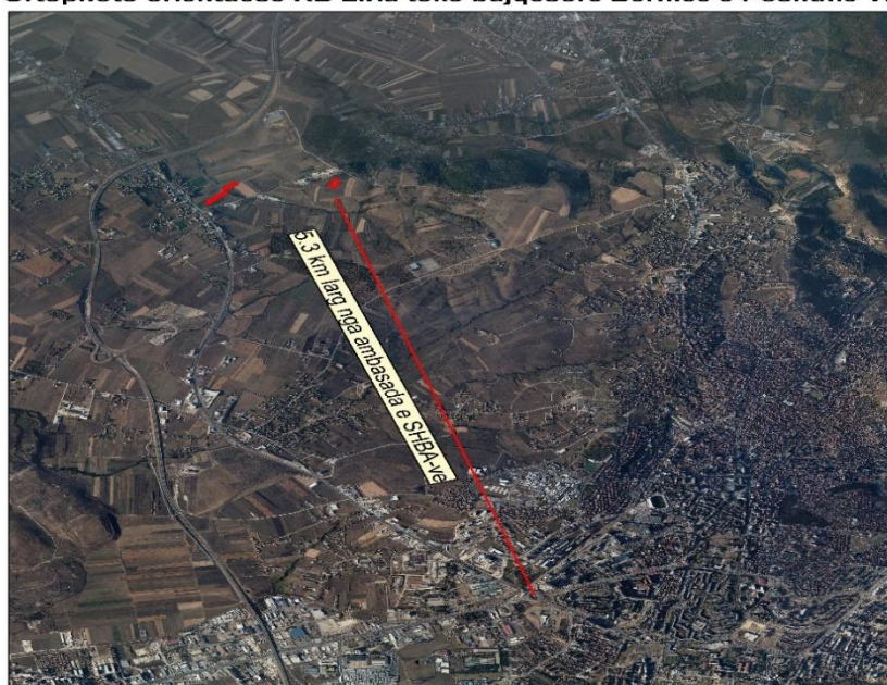
Ortophoto orientuese KB Liria toke bujqësore Bernice e Poshtme VII

Foto/fotot ose informata të tjera për asetet në shitje