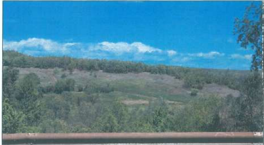
Pamje e parcelës nr.1149-0 z.k Kralan, Komuna e Gjakovës

Fotografia e mëposhtme prezanton gjendjen e parcelës nr. 1149-0 z.k Kralan, Komuna e Gjakovës: