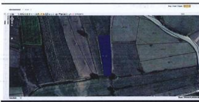
Fig.1 Ortofoto, parcela kadastrale nr. 648-0, ZK Vlashnjë; http://geoportal.ks.gov.net/

Nga raporti i te dhënave kadastrale (Certifikata nga SIXTK, shërbimet digjitale) prona evidentohet në emër të Pasuri Shoqërore K.B.I PROGRES me numër të njësisë P-71813006-00648-0; sipërfaqe 841m 2 ; kulture bujqësore Arë e klasës 1-rë.