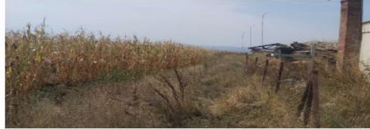
Fig. 2 Fotografi nga terreni

AGJENCIA KOSOVARE E PRIVATIZIMIT KOSOVSKA AGENCIJA ZA PRIVATIZACIJU PRIVATISATION AGENCY OF KOSOVO