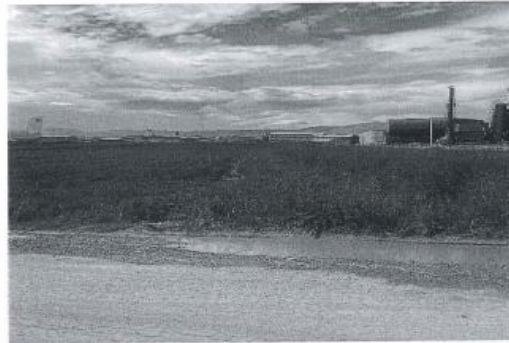
Fig. 2 Fotografii nga terreni

AGJENCIA KOSOVARE E PRIVATIZIMIT KOSOVSKA AGENCIJA ZA PRIVATIZACIJU PRIVATISATION AGENCY OF KOSOVO