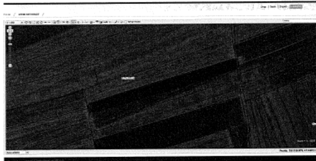
Fig.1 Ortofoto, parcela kadastrale nr.1901-2, ZK Llaplasellë; http://geoportal.rks.gov.net/

Nga raport i të dhënave kadastrale (SIKTK, shërbimet digjitale) prona evidentohet në emër të P.SH KBI Kosova Export, Fushë Kosovë me numër të njësisë P-73414042-01901-2 e cila ka sipërfaqe 3897m 2 me kulture bujqësore Arë e Klasës 3.