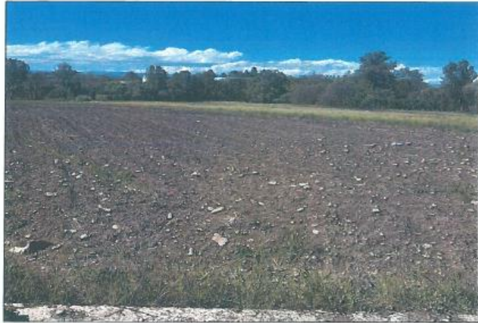
Pamje e parcelës nr.97-2 z.k. Gjurjevik, Klinë

Fotografia e mëposhtme prezanton gjendjen faktike në terren :