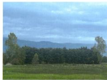
Fig. 1 Ortofoto, Fotografia e terrenit për parcelën kadastrale 424-6

Zyrtare Kadastrale: Blerta Jashari Kastrati