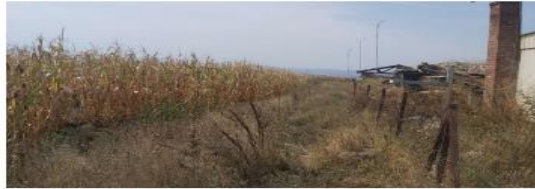
Fig. 2 Fotografji nga terreni

AGJENCIA KOSOVARE E PRIVATIZIMIT KOSOVSKA AGENCIJA ZA PRIVATIZACIJU PRIVATISATION AGENCY OF KOSOVO