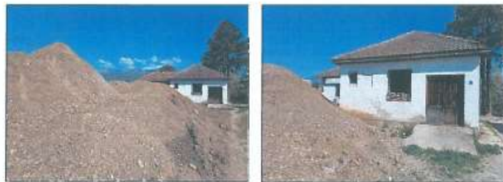
Stacioni i Veterinës në z.k GjuraKoc, Komuna e Istogut

Të vetmin ndryshim nga vizita e fundit në terren e konstatuam se në afërsi të objektit zhvillohen punime dhe aty janë grumbulluar masa të mëdha të dheut.