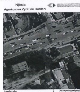
Ortfoto e lokalit NSH.AGROKOSOVA ZYRAT NE DARDANI.