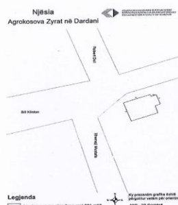
Skica e lokalit NSH.AGROKOSOVA ZYRAT NE DARDANI.