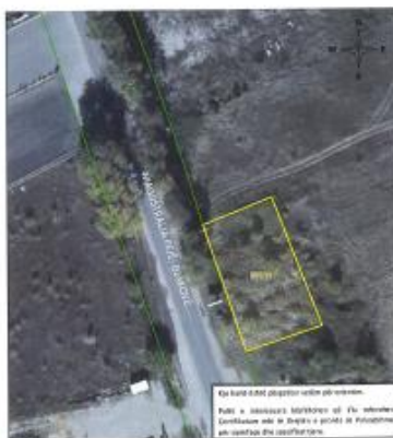
Fig. 1. Ortofoto, parcela kadastrale 451-13 ZK Bellopojë

Toka është e regjistruar në certifikatën e pronësisë, parcela kadastrale me nr të njësisë P-71611004-00451-13 me sipërfaqe 800m 2 me kulturë Arë e klasës 3 1/1, në vendin e quajtur "Brezhanik".