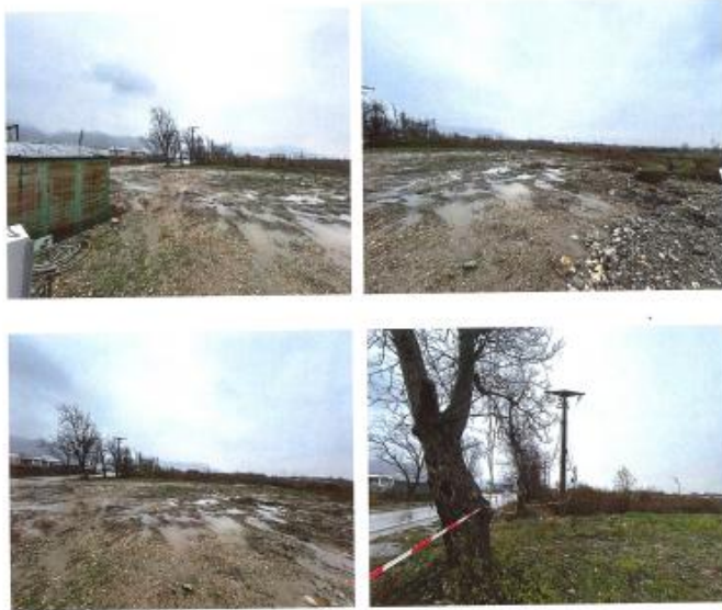
Fig.2. Fotografitë e terrenit, gjendja faktike e tokës

Zyrtare Kadastrale Rajonale : Blerta Jashari Kastrati