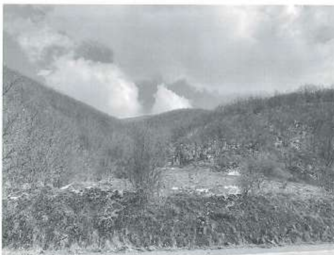
Fatos Latifi Zyrtar Kadastral

AGJENCIA KOSOVARE E PRIVATIZIMIT KOSOVSKA AGENCIJA ZA PRIVATIZACIJU PRIVATISATION AGENCY OF KOSOVO