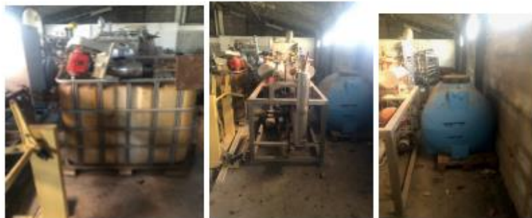
6 nga 9