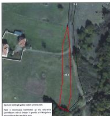
Fig.1 Ortofoto, parcela kadastrale 178-0 ZK Zhub, K.Gjakovë

Toka është e regjistruar në certifikatën e pronësisë, parcela kadastrale me nr të njësisë P-70705033-00178-0 me sipërfaqe 1358m 2 me kulturë Kullosë e klasës 4 1/1 në vendin e quajtur "Kodra Kabash".