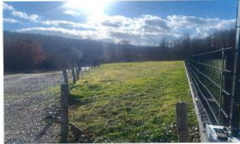
Fig. 2 Fotografitë e mëposhtme paraqesin gjendjen faktike në terren:

Vërejtje: Në anën perëndimore të parcelës kadastrale me nr 178-D ekziston rrethojë faktike teli nga pala fqinje për të cilën është e nevojshme matje precize në terren për të përcaktuar saktë pozicionin e kësaj rrethoje në terren.