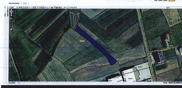
Fig.1 Ortofoto, parcela kadastrale nr. 1213-0, ZK Radostë; http://geoportal.rks-gov.net/

Nga raporti i te dhënave kadastrale (Certifikata nga SIKTK, shërbimet digjitale) prona evidentohet në emër të P.SH.E KOSOV.K.K.RAHOVEC-SHFRY.N.B.LRAHOVECI me numër të njësisë P-71510067-01213-0; sipërfaqe 2737m 2 ; kulture bujqësore Are e klasës 3-të.