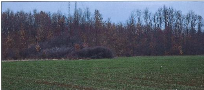
Pamje e parcelës nr.399-2 z.k Kovragë

Fotografitë e mëposhtme prezantojnë gjendjen faktike në terren :