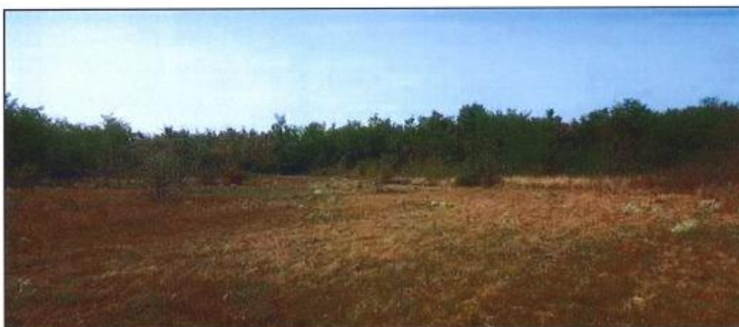
Pamje e parcelës nr.400-2 z.k Kovragë