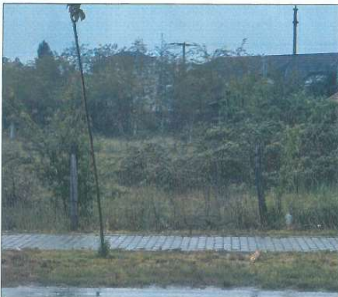
Pamje e parcelës nr.939-4 dhe 939-5 z.k Skivjan, Komuna e Gjakovës

Fotografia e mëposhtme prezanton gjendjen e parcelës nr. 939-4 dhe 939-5 z.k Skivjan, Komuna e Gjakovës: