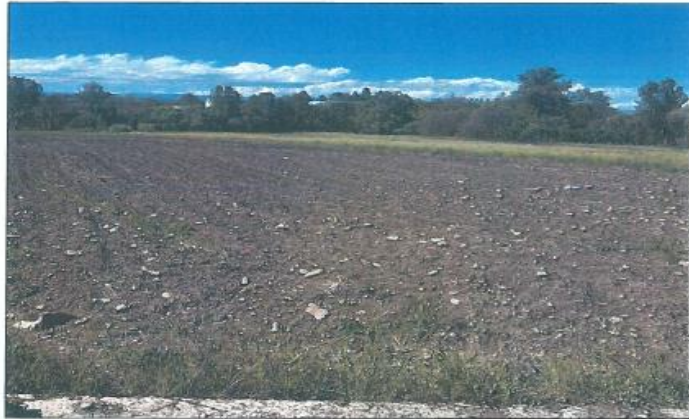
Pamje e parcelës nr.97-2 z.k Gjurgjevik, Klinë

Fotografia e mëposhtme prezanton gjendjen faktike në terren :