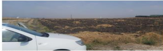
Fig. 2 Fotografji nga terreni

AGJENCIA KOSOVARE E PRIVATIZIMIT KOSOVSKA AGENCIJA ZA PRIVATIZACIJU PRIVATISATION AGENCY OF KOSOVO