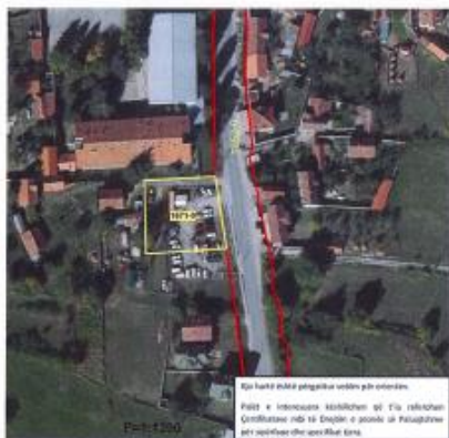
Fig.1 Ortofoto, parcela kadastrale 1671-0 ZK Strellc i Epërm

Toka është e regjistruar në certifikatën e pronësisë, parcela kadastrale me nr të njësisë P-70511022-01671-0 me sipërfaqe 1525m 2 me kulturë Livadh i klasës 4/Tokë ndërtimore/Oborr 1/1 në vendin e quajtur "Strellc i Epërm".