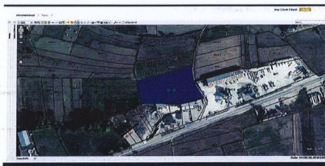
Fig.1 Ortofoto, parcelat kadastrale nr. 665-0 dhe 666-0, ZK Vlashnje; http://geoportal.rks-gov.net/

Nga raporti i të dhënave kadastrale (Certifikata nga SIKTK, shërbimet digjitale) prona evidentohet në emër të Pasuri Shoqërore K.B.I PROGRES me numër të njësisë P-71813006-00665-0 ; sipërfaqe 2383m 2 ; kulture bujqësore Arë e klasës 2-të dhe P-71813006-00666-0 ; sipërfaqe 2800m 2 ; kulture bujqësore Livadh i klasës 2-të.