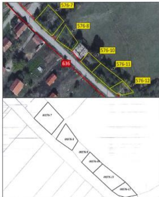
Ortofoto dhe kopjet e planit për parcelat e lartëcekura në z.k Videjë, Komuna e Klinës.

Parcela nr.576-7 ka sipërfaqe prej 435 m 2 me kulturë : bujqësore, kullosë e klasës 1; Parcela nr.576-8 ka sipërfaqe prej 258 m 2 me kulturë : bujqësore, kullosë e klasës 2; Parcela nr.576-10 ka sipërfaqe prej 197 m 2 me kulturë : bujqësore, kullosë e klasës 2; Parcela nr.576-11 ka sipërfaqe prej 360 m 2 me kulturë : bujqësore, kullosë e klasës 2; Parcela nr.576-12 ka sipërfaqe prej 175 m 2 me kulturë: bujqësore, kullosë e klasës 2.