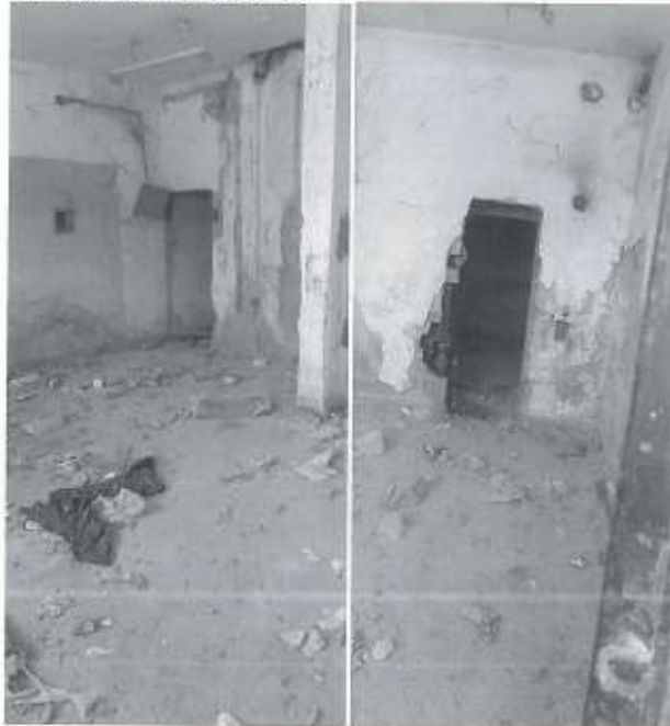
Foto e lokalit nga ana e mbrendshme.

Agjencia Kosovare e Privatizimit Rruga: Dritan Hoxha, nr.55 10000 Prishtinë, Republika e Kosovës