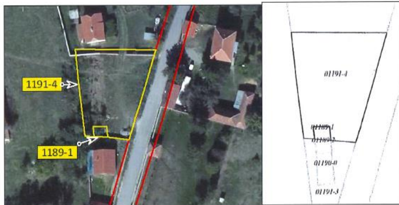
Ortofoto dhe kopjet e planit për parcelat nr.1189-1 dhe 1191-4 z.k Cërmjan, Komuna e Gjakovës

Parcela nr.1191-4 ka sipërfaqe prej 1093m 2 me kulturë : Infrasktrukturë/Rrugë e rendit II me sip.918 m 2 dhe tokë ndërtimore/shtëpi-ndërtesë me sip.175m 2 .