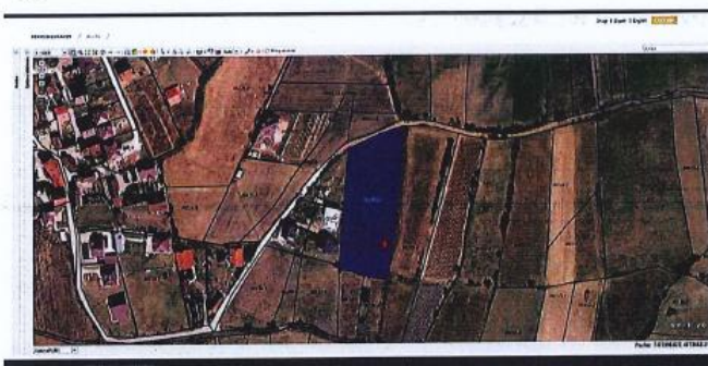
Fig.1 Ortofoto, parcelat kadastrale nr. 158-2 dhe 158-3, ZK Vlashnjë; http://geoportal.rks-gov.net/

Nga raporti i te dhënave kadastrale (Certifikata nga SIKTK, shërbimet digjitale) prona evidentohet në emër të Pasuri Shoqërore K.B.I PROGRES me numër të njësisë P-71813006-00158-2; sipërfaqe 4145m 2 ; kulture bujqësore Arë e klasës 3-të dhe P-71813006-00158-3; sipërfaqe 652m 2 ; kulture bujqësore Livadh i klasës 2-të.