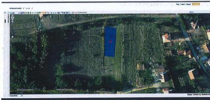
Fig.1 Ortofoto, parcela kadastrale nr. 623-2, ZK Sopijë; http://geoportali.aks.gov.net/

Nga raporti i te dhënave kadastrale (Certifikata nga SIKTK, shërbimet digjitale) prona evidentohet në emër të Pasuri Shoqërore N.B.I. Suharekë me numër të njësisë P-72116043-00623-2 ; sipërfaqe 668m 2 ; kulture bujqësore Vreshtë e klasës 2-të.