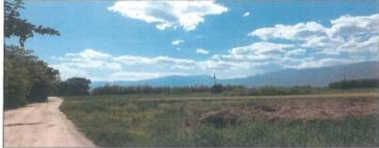
Pamje e parcelës nr.380-1 s.k. Dubravë, Ictog

Fotografia e mëposhtme prezanton gjendjen faktike të parcelës nr.380-1 s.k. Dubravë: