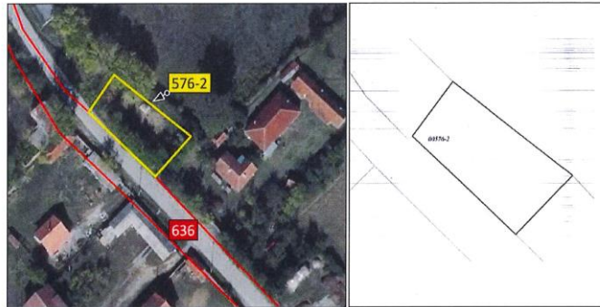
Ortofoto dhe kopja e planit për parcelën nr. 576-2 z.k Videjë, Komuna e Klinës.

Parcela sipas certifikatës së pronësisë evidentohet në emër të KBI Bujqësia, me sipërfaqe prej 497m 2 dhe kulturë bujqësore-kullosë e klasës 1.