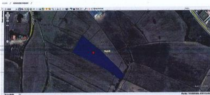
Fig.1 Ortofoto, parcelat kadastrale nr.928-0 dhe 929-0 ZK Turjakë ; http://geoserial.ks-gov.net/

Nga raporti i të dhënave kadastrale (Certifikata nga SHKTK, shërbimet digjitale) prona evidentohet në emër të OPB Mirusha me numër të njësisë P-72310076-00928-0 me sipërfaqe 520m 2 si dhe P-72310076-00929-0 me sipërfaqe 2801m 2 të cilat kanë shfytëzimin si tokë bujqësore Are dhe Livadh të klasës së 6-të.