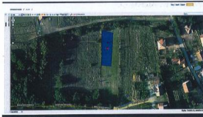
Fig.1 Otofoto, parcela kadastrale nr. 623-2, ZK Sopijë; http://reoserial.rks-gov.net/

Nga raporti i të dhënave kadastrale (Certifikata nga SIKTK, shërbimet digjitale) pronn evidentohet në emër të Pasuri Shoqërore N.B.L. Suharekë me numër të njësisë P-72116043-00623-2 ; sipërfaqe 668m 2 ; kulture bujqësore Vreshtë e klasës 2-të.