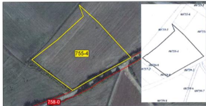
Ortofoto dhe kopja e planit për parcelën nr.755-4 z.k Korenicë, Komuna e Gjakovës

Sipërfaqja grafike është më e madhe për +15m 2 se toleranca e lejuar e mospërrthues 84m 2 .