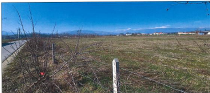
Pamje e parcelës nr.755-4 z.k Korenicë, Komuna e Gjakovës

Fotografia e mëposhtme prezanton gjendjen faktike të parcelës nr.755-4 z.k Korenicë, Komuna e Gjakovës: