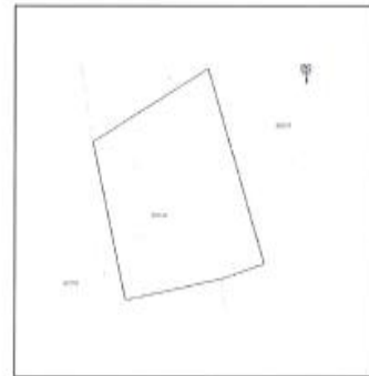
Ortofoto dhe kopja e planit për parcelën nr.227-19 z.k Kosh, Komuna e Istogut.

Nga vizita jonë në terren konstatuam se :