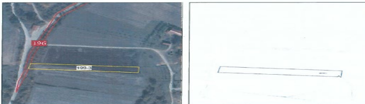
Ortofoto dhe kopja e planit për parcelën nr.199-3 z.k Dranashiq, Komuna e Klinës

Parcela sipas certifikatës së pronësisë evidentohet në emër të NPB Malishgan, me sipërfaqe prej 1566m 2 (15 ari dhe 66 m 2 ) me kulturë : bujqësore, arë e klasës 4.