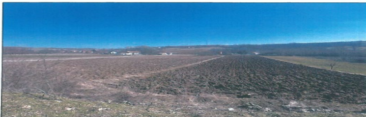
Pamje e parcelës nr.199-3 z.k Dranashiq, Klinë.

Fotografia e mëposhtme prezanton gjendjen e parcelës nr.199-3 z.k Dranashiq, Klinë: