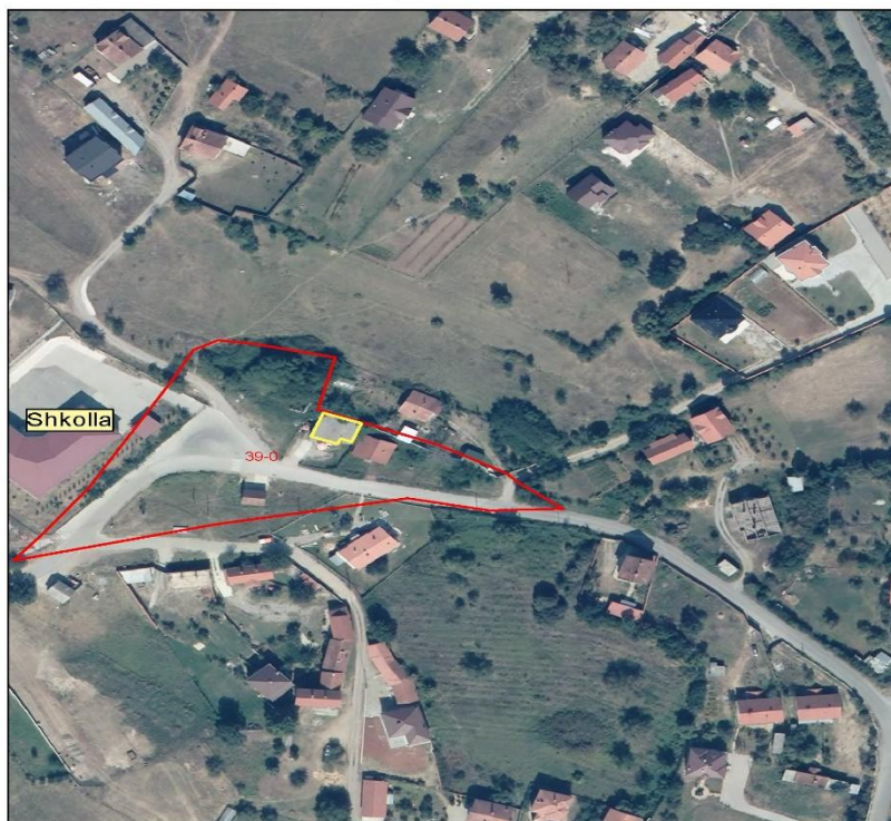
NSH 25 Maji-Lokali ne Kosterc

Foto/fotot ose informata të tjera për asetet në shitje