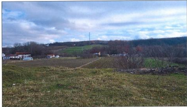
Pamje e parcelës nr.199-3 z.k Dranashiq, Klinë.

Fotografia e mëposhtme prezanton gjendjen e parcelës nr.199-3 z.k Dranashiq, Klinë: