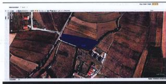
Fig.1 Ortofoto, parcela kadastrale nr. 114-0, ZK Vlashnjë; http://www.pak-ks.org

Nga raporti i te dhënave kadastrale (Certifikata nga SIKTK, shërbimet digjitale) prona evidentohet në emër të Pasuri Shoqërore K.B.I PROGRES me numër të njësisë P-71813006-00114-0; sipërfaqe 4028m 2 ; kulture bujqësore Arë e klasës 6-të.