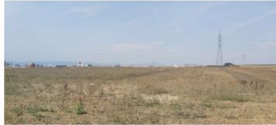
Fig. 2 Fotografi nga tereni

AGJENCIA KOSOVARE E PRIVATIZIMIT KOSOVSKA AGENCIJA ZA PRIVATIZACIJU PRIVATISATION AGENCY OF KOSOVO