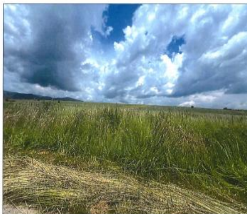
Fig. 1 Fotografia e terrenit për parcelën 631-0 ZK Sushicë