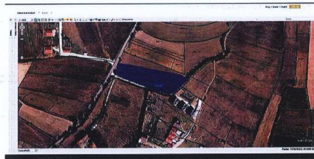
Fig.1 Ortofoto, parcela kadastrale nr. 114-0, ZK Vlashnjë; http://geoportal.rks-gov.net/

Nga raporti i te dhënave kadastrale (Certifikata nga SIKTK, shërbimet digjitale) prona evidentohet në emër të Pasuri Shoqërore K.B.I PROGRES me numër të njësisë P-71813006-00114-0; sipërfaqe 4028m 2 ; kulture bujqësore Arë e klasës 6-të.