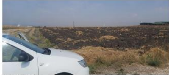
Fig. 2 Fotografji nga terreni

AGJENCIA KOSOVARE E PRIVATIZIMIT KOSOVSKA AGENCIJA ZA PRIVATIZACIJU PRIVATISATION AGENCY OF KOSOVO