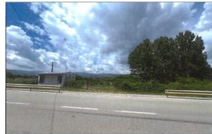
Fig. 1 Fotografitë e terrenit për parcelën 160-1 ZK Rakosh

Zyrtare Kadastrale: Blerta Jashari Kastrati