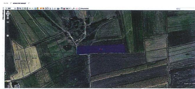
Fig.1 Ortofoto, parcela kadastrale nr.410-0 ZK Xërxë ; http://geoportal.rks-gov.net/

Nga raporti i te dhënave kadastrale (Certifikata nga SIKTK, shërbimet digjitale) prona evidentohet në emër të P.S.H.E KOSOV.K.K.RAHOVEC-SHFRY.N.B.I.RAHOVECI me numër të njësisë P-71510033-00410-0 me sipërfaqe 2398m 2 .