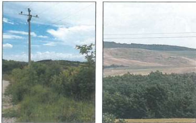
Pamje e parcelës nr.56-30 dhe pamje nga largësia e parcelës nr.56-41 z.k Dranashiq

Fotografia e mëposhtme e realizuar nga largësia prezanton gjendjen e parcelave në z.k Dranashiq: